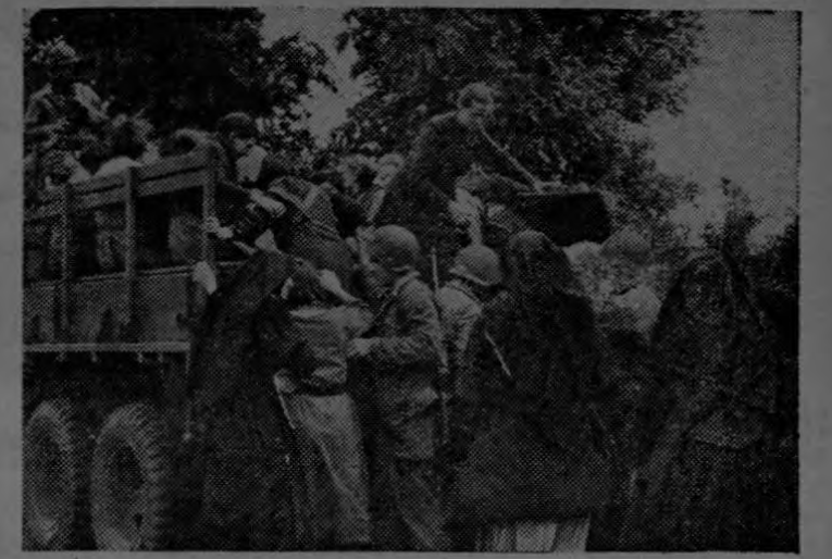
Soldados de los Estados Unidos trasladan en Normandía a las monjas y aldeanas de una región amenazada por el fuego de la artillería alemana.