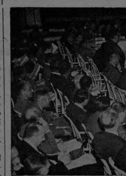
Una sesión de la Conferencia Monetaria