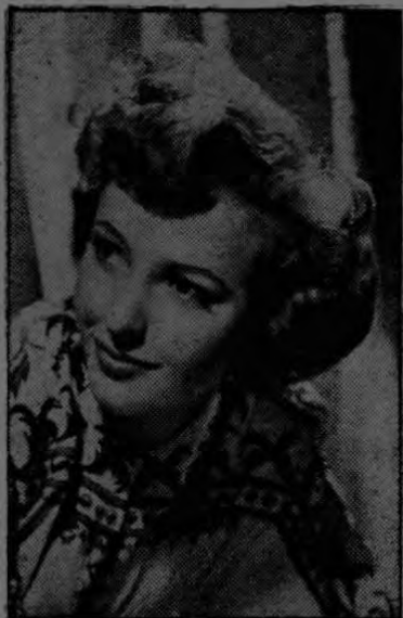
Max Factor Jr., consultor de belleza de las estrellas de Hollywood, asegura que las bonitas y atractivas cabelleras de las artistas, como LARAINÉ DAY de Paramount, requieren especiales atenciones y cuidados.

En todas las investigaciones llevadas a cabo sobre la materia, se ha llegado a la conclusión definitiva de que la teoría de que el champú, con frecuencia, estropea el cabello.